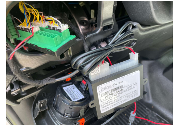
CAN Bus Leiste hinter dem Lichtschalter.